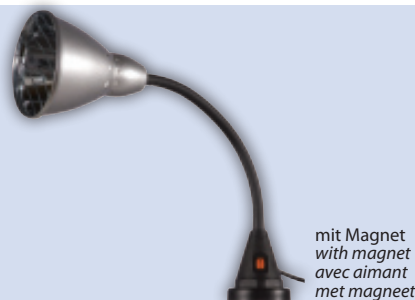
mit Magnet with magnet avec aimant met magneet

optional / optional / optionnel / optioneel