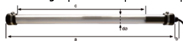
Abmessungen in mm | Dimensions in mm